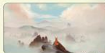
«Tête en l'air»