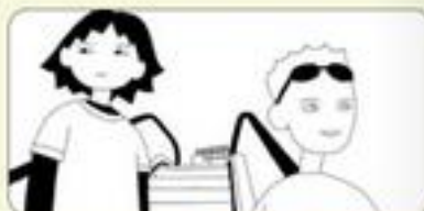
«Amour et faux-semblants»