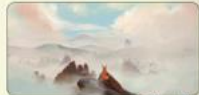
«Tête en l'air»