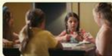
«Les dents du bonheur»