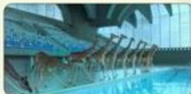
«5 mètres 80»