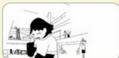
«Amour et faux semblants»